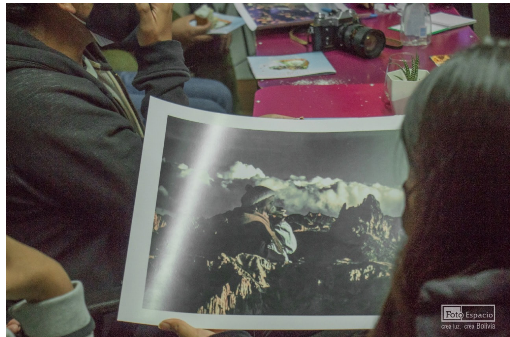
Foto Espacio crea luz, crea Bolivia