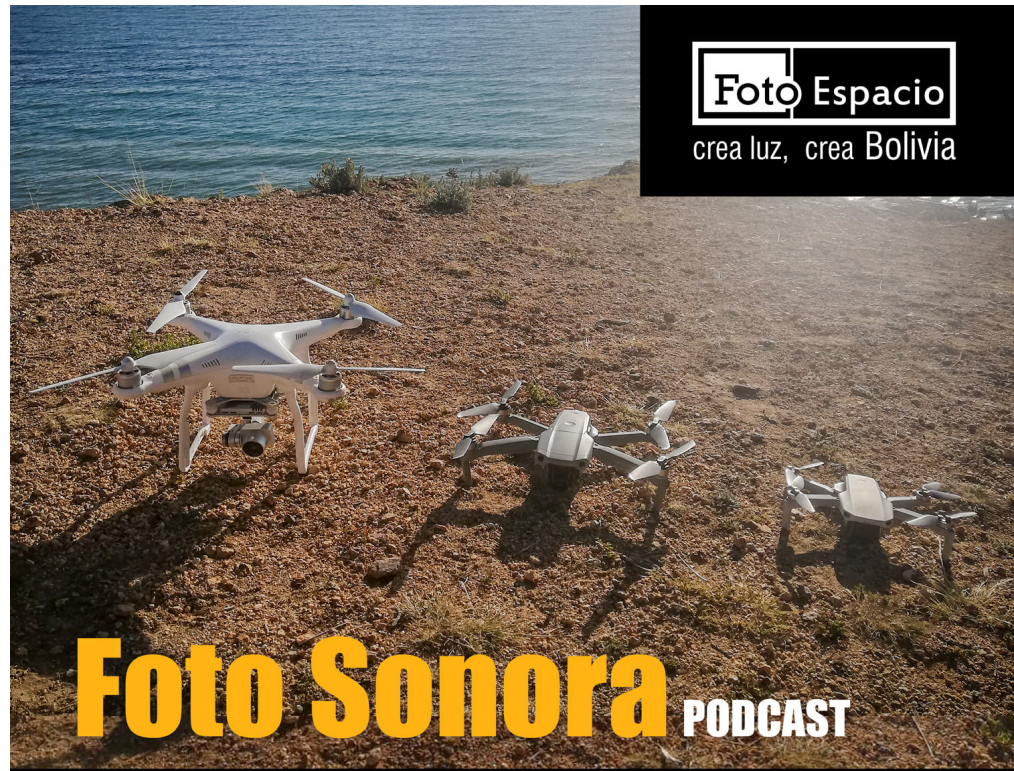
Foto Sonora PODCAST