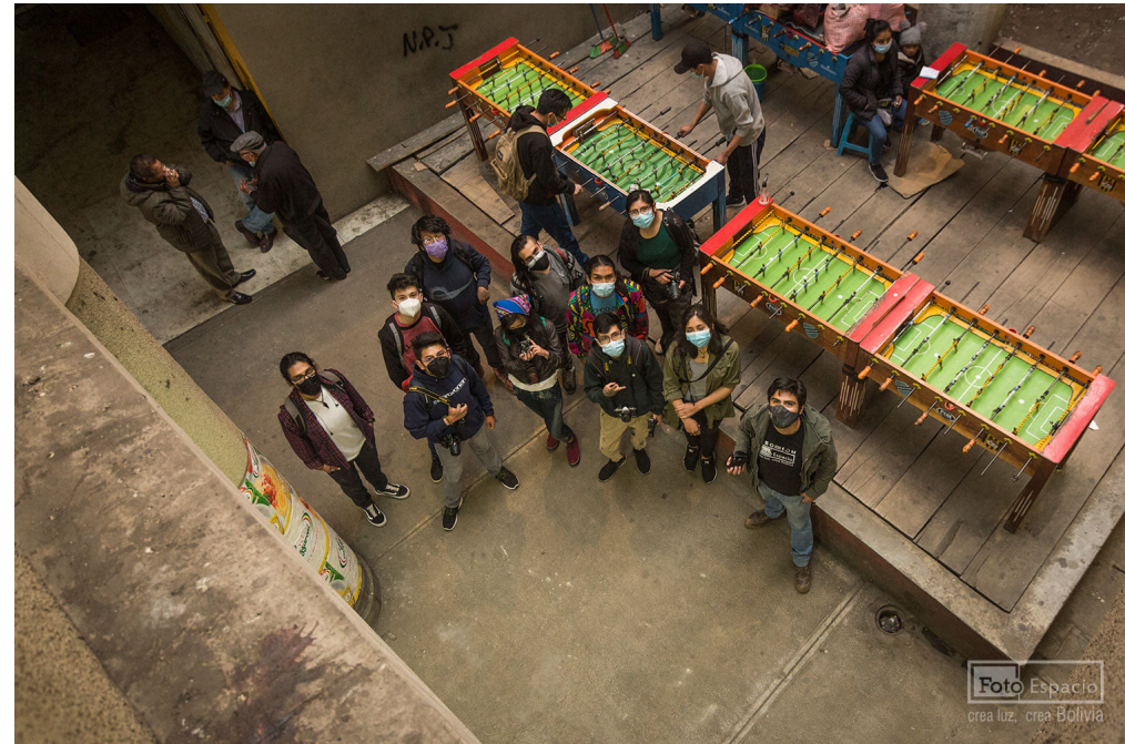
Foto Espacio crea luz, crea Bolivia

El martes 17 de agosto se realizó una salida fotográfica callejera en el Mercado Lanza, donde al finalizar los participantes analizaron las fotografías que tomaron.