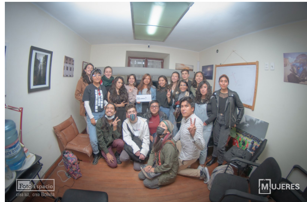
Foto Espacio crea luz, crea Bolivia