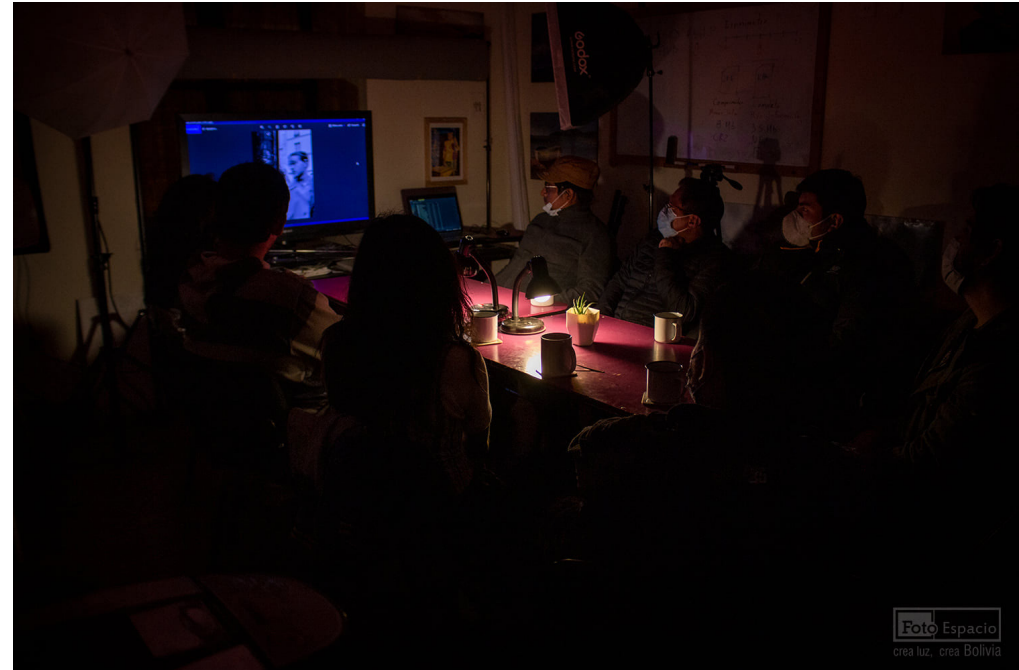
Foto Espacio crea luz, crea Bolivia

Se dio una pequeña introducción a lo que fue la vida del fotógrafo y progreso de lo que fue su trabajo fotográfico.