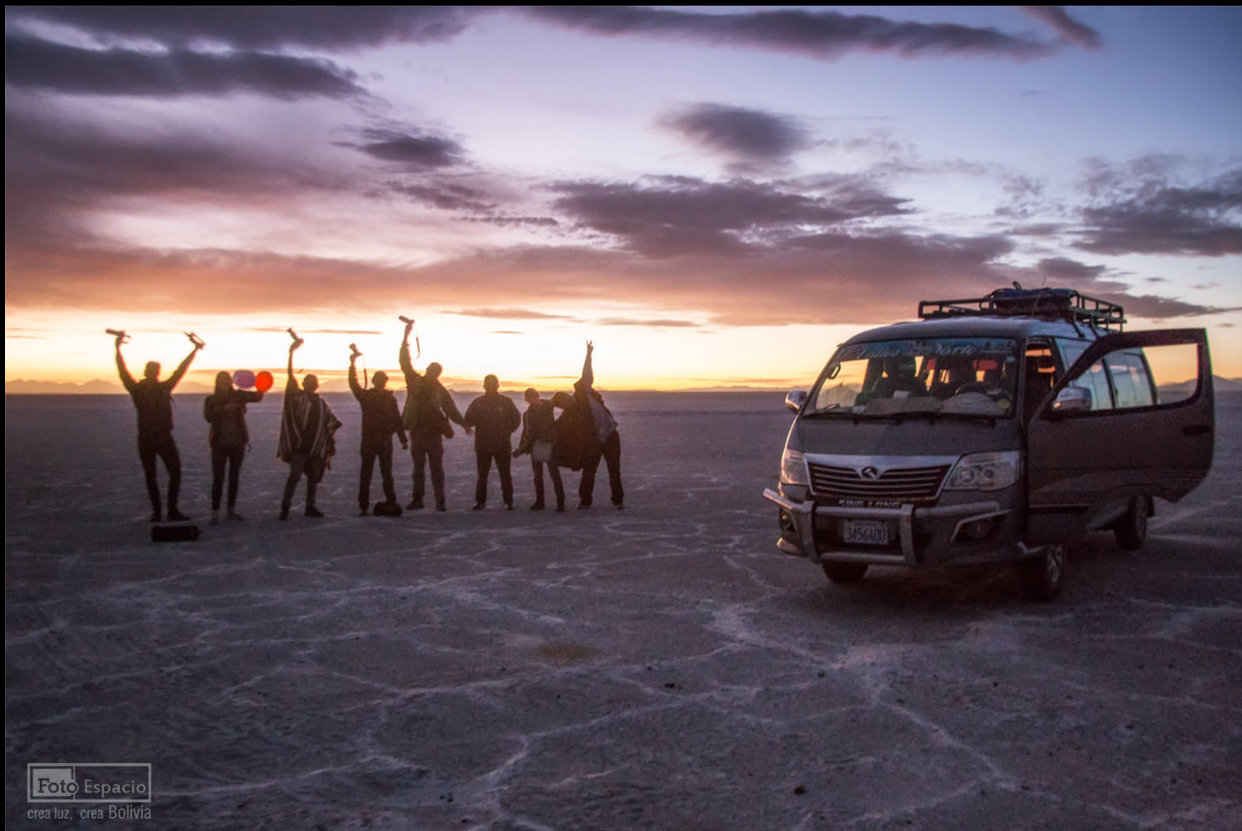
Foto Espacio crea luz, crea Bolivia

Se realizó un retiro y viaje fotográfico rumbo a la localidad de Coqueza, que se encuentra en el municipio de Tahua, a faldas del volcán Tunupa.