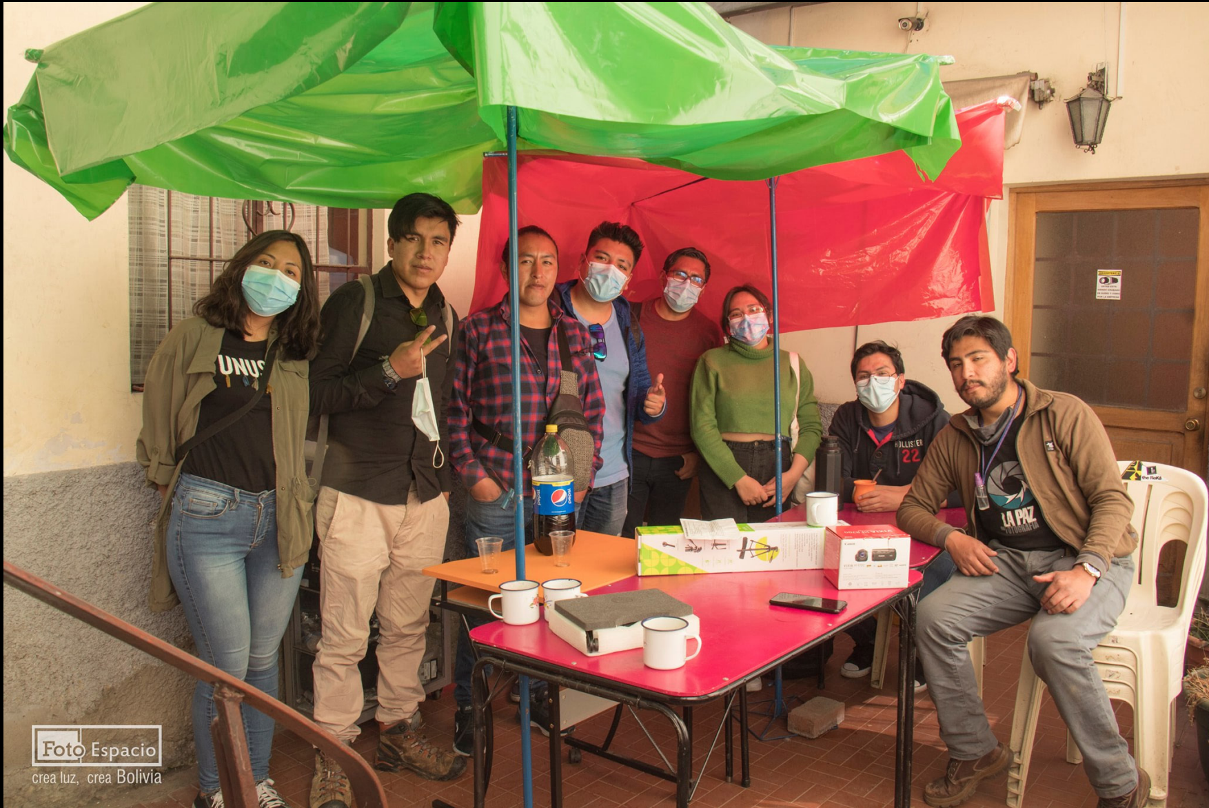
Foto Espacio crea luz, crea Bolivia

Dentro de las actividades del mes de agosto se realizó la 4ta feria de compra, venta y trueque de accesorios fotográficos.