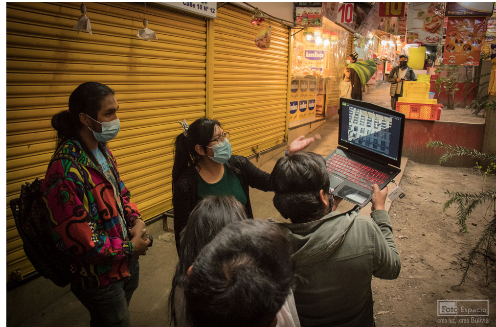
Foto Espacio crea luz, crea Bolivia