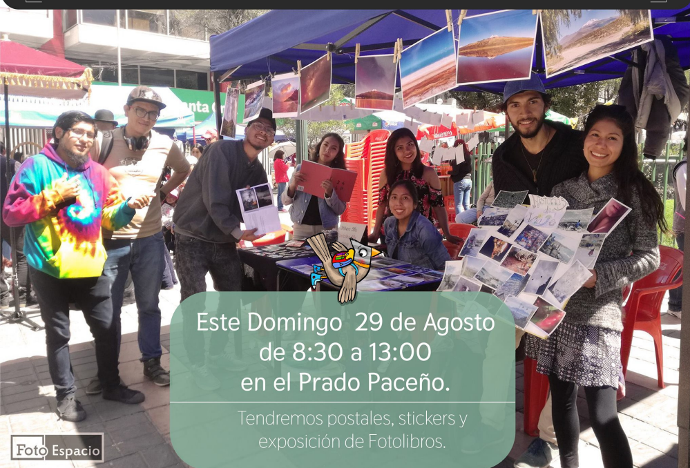
Foto Espacio crea luz, crea Bolivia

Para finalizar el mes de agosto, Foto Espacio estuvo presente en la Feria Cultural de Mil Colores organizada por la alcaldía.