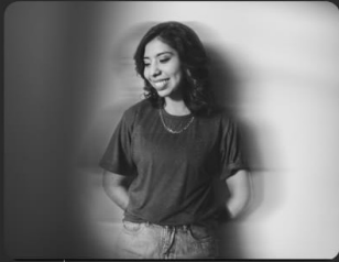
• La Nuez