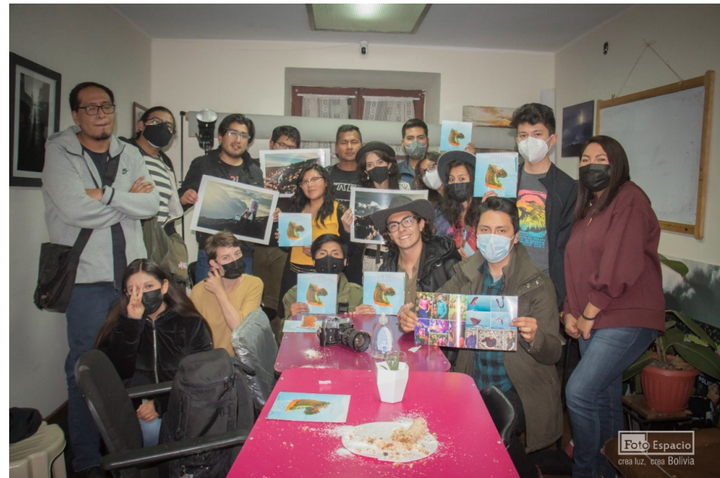
Foto Espacio crea luz, crea Bolivia

En este conversatorio se habló sobre el montaje fotográfico como herramienta de la imagen.